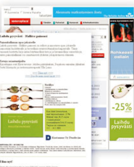
Kustannus Oy Duodecim