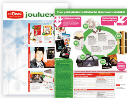
Home Entertainment Finland