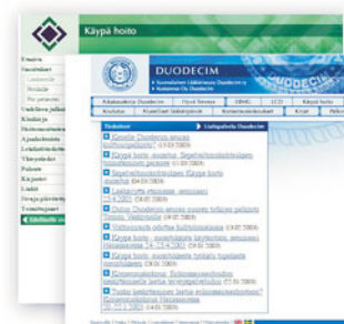
Terveysportti/ Kustannus Oy Duodecim